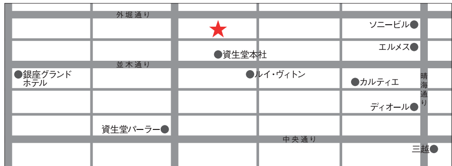
★ … 〒104-0061 東京都中央区銀座七丁目4-5 銀座745ビル 4階